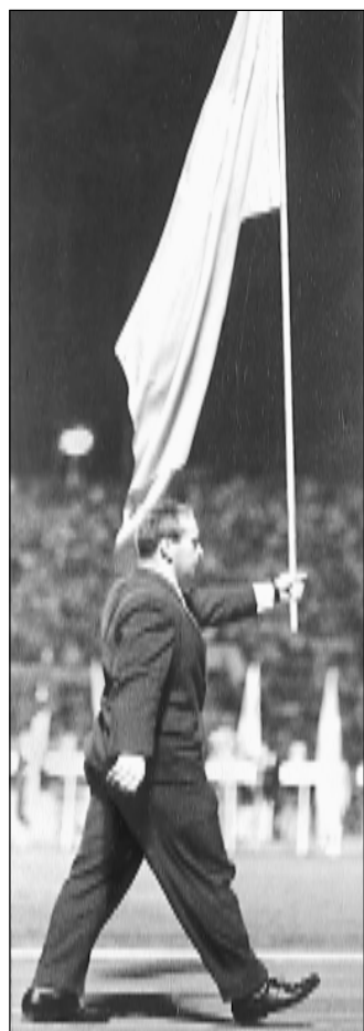
«Рим. 1960 год. Олимпийский чемпион Юрий Власов закрывает XVII Олимпийские игры. Знамя Родины он сумел пронести на вытянутой руке вокруг всего стадиона. Зрители стоя рукоплескали».

Сегодня Юрий Петрович — почетный гость нашей газеты. Он отвечает на письмо, которое, на наш взгляд, будет интересно читателям.